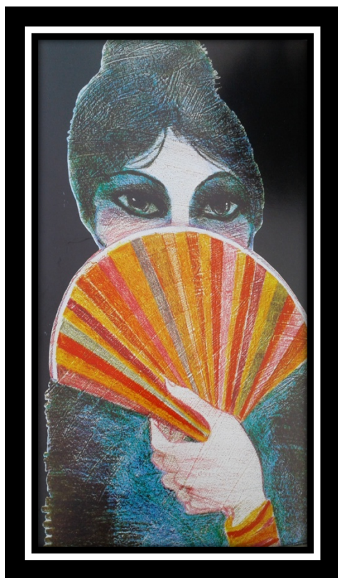
Ilustración: Julio Corredera

Tomada de la obra de Lucrecia Castagnino. Tetralogía Latinoamericana. Muere el Quetzal. La Perricholi. Doña Martina. Manuela Sáenz. 1972-1988. Córdoba, Argentina: 2000, 30.